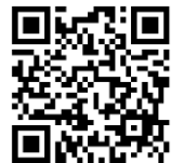
加入 WhatsApp 廣播名單， 每天收取信息通知